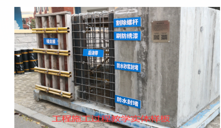
图1 地下室外墙施工实体样板

“住宅楼的地下室外墙为什么会渗水?”“钢筋笼在绑扎时到底该留多少保护层?”“模板支撑架塌了,原因究竟藏在何处节点?”……这些在传统课堂里只能靠想象、到工地又难再现的施工难题,如今在郑工智能建造学院有了“标准答案”。在数字化浪潮席卷建筑业的今天,郑工工业应用技术学院智能建造学院以“实体样板情境教学+虚拟仿真智能训练”双核驱动的创新教学模式,成功破解施工技术教学“看不见、进不去、难再现”的行业痛点。该项目凭借9大全工序实体样板集群与BIM虚拟建造系统的深度耦合,取得了较好的教学效果,为应用型土木人才培养树立新标杆。