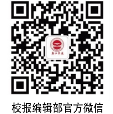
校报编辑部官方微信